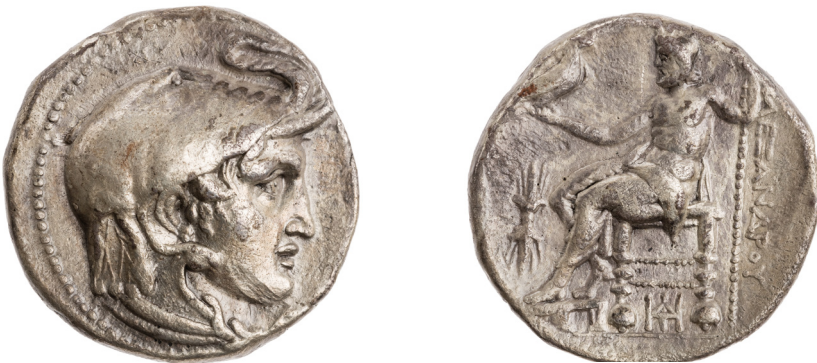
Fig. 2. Tetradracma de plata acuñado por el sátrapa de Egipto, Ptolomeo (ca. 319-317 a.C.). En el anverso se representa a Alejandro III de Macedonia con las exuviae elephantis y unos cuernos de carnero. En el reverso a Zeus sentado sobre su trono portando su cetro y un águila. Leyenda: ΑΛΕΞΑΝΔΡΟΥ. American Society Numismatic 1974.26.582.