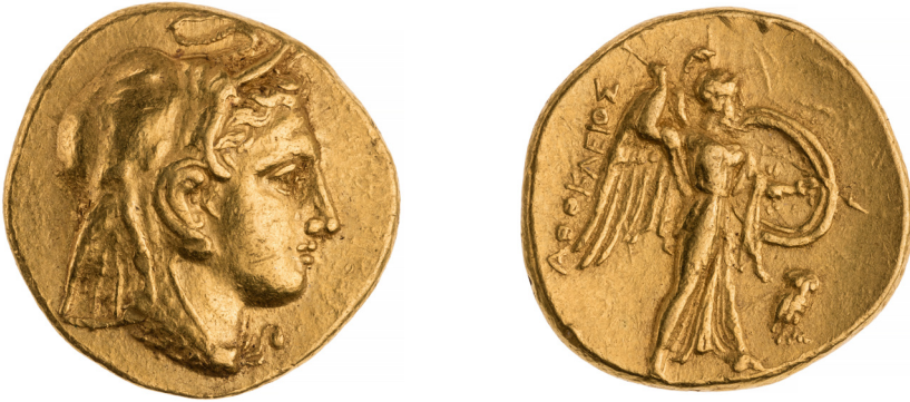
Fig. 1. Estáttera de oro acuñada por Agatocles de Siracusa (ca. 310-304 a.C.). En el anverso se representa una efigie masculina (¿Alejandro III de Macedonia?) con las exuviae elephantis y la égida. En el reverso aparece una representación de una Niké alada con una lechuza. Leyenda: ATHOKLEIOS.