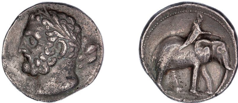
Fig. 4. Shekel hispanocartaginés de plata acuñado probablemente en Qart Hadasht (ca. 228-221 a.C.), procedente del Tesoro de Mogente. En el anverso se representa una efigie barbada (¿Amílcar Barca?) con una corona de laurel que porta una clava. En el reverso se representa a un elefante africano de bosque dirigido por su cornaca mediante una aguijada. British Museum 1911,0702.1.