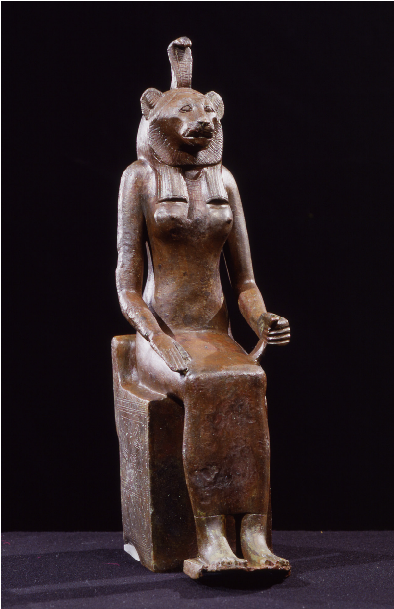
Fig. 7. Bronzetto raffigurante la dea Uto. MCABo EG 294.