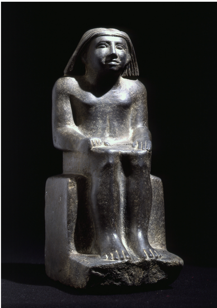
Fig. 6. Statua di personaggio anonimo. MCABo EG 1826. Cortesia del Museo Civico Archeologico