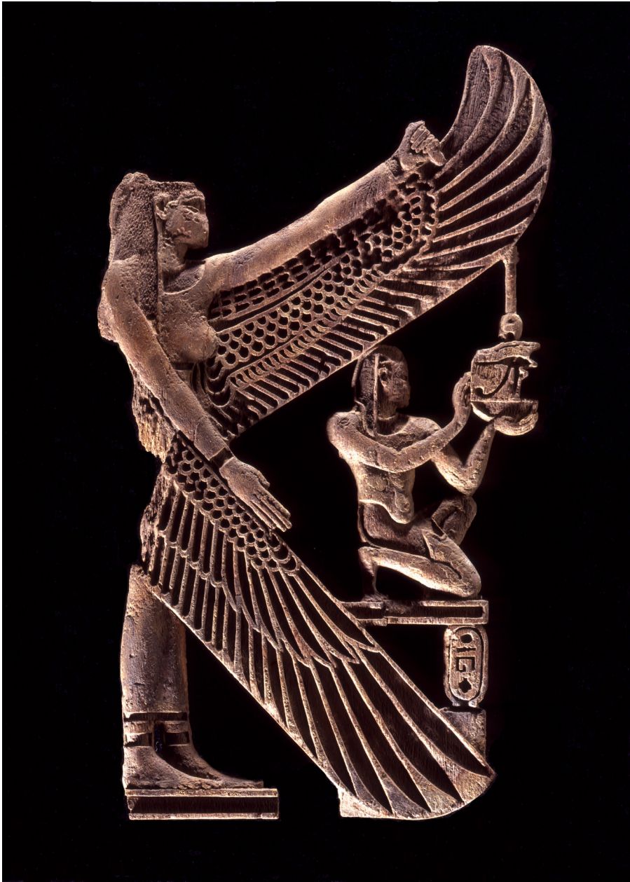
Fig. 3. Frammento di naos a nome di Petubasti Sch(er)ibra. MCABo EG 289.