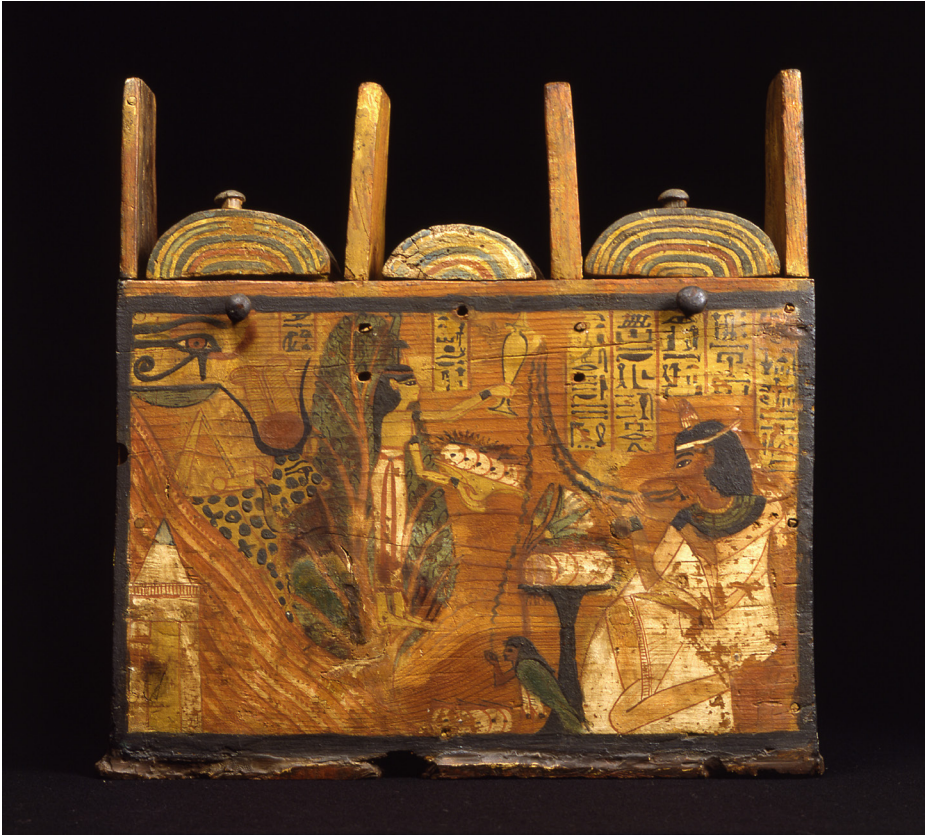
Fig. 5. Cofanetto porta-ushabti a nome di Thauenhuy. MCABo EG 1969.