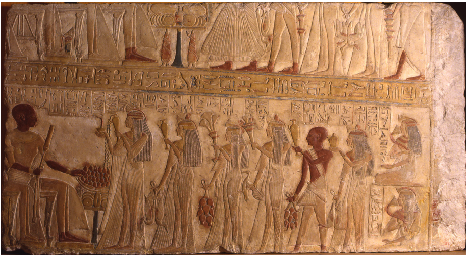
Fig. 2. Rilievo di Ptahmes. MAF, Sezione 'Museo Egizio', inv. 2557.