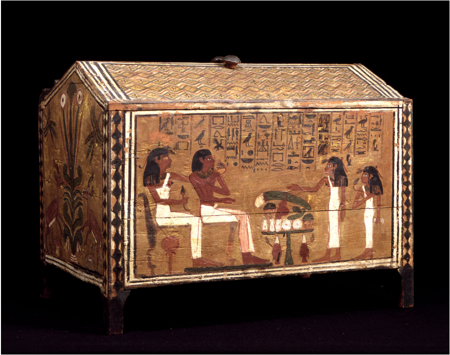
Fig. 4. Cofanetto a nome di Perpauti. MCABo EG 1970.