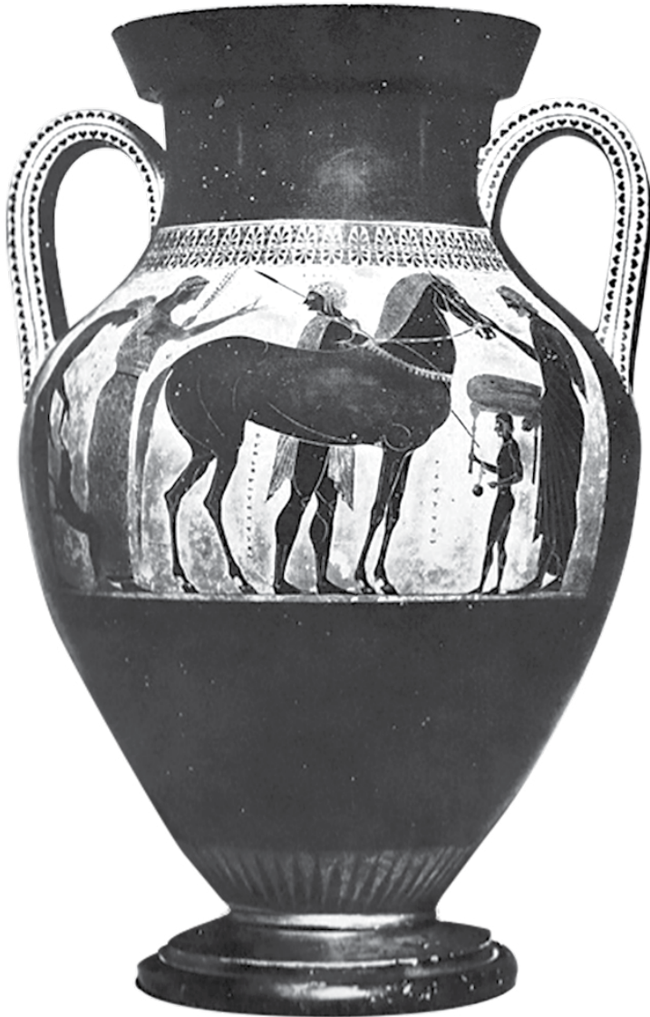
Fig.2: (B)

(B) Polideuces e Castor chegam a casa. Polideuces inclina-se para saudar o cão, Castor segura as rédeas do cavalo; Leda oferece uma flor a Castor, Týndaro acaricia o cavalo, um escravo traz um banco com uma peça de tecido dobrada e um aryballos .